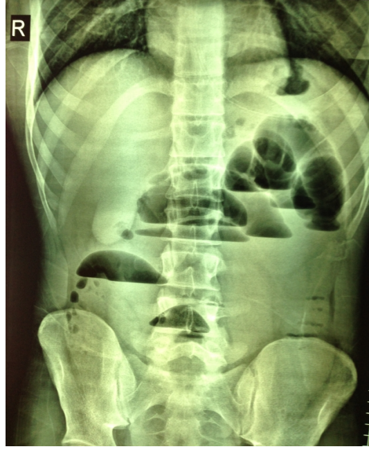
Şekil 1 : Başvuru anındaki ayakta direkt karın grafisinde hava sıvı seviyeleri

Üç gündür gaz-gayta deşarjı olmayan 17 yaşındaki erkek hasta acil polikliniğine başvurdu. Hastanın öyküsünde, geçirilmiş karın cerrahisi olmadığı ve 1 ay önce benzer şikayetlerle hospitalize edilip, nazogastrik (NG) dekompresyon, rektal lavman vs. non-operatif tedavi ile taburcu edildiği öğrenildi. Karın muayenesinde bağırsak sesi yoktu. Distansiyon ve hassasiyet mevcutken, rebound ve defans saptanmadı. Rektum, digital muayenede, boş olarak tespit edildi. Ayakta direkt karın grafisinde hava sıvı seviyeleri mevcut olan hastanın (Şekil 1), karın ultrasonografisinde (USG) batın alt kadranda barsak ansları arasında serbest sıvı olup, aperistaltik ansların çapı 4 cm'ye ulaşmaktaydı. Karın tomografisinde de USG ile aynı bulgular saptandı.