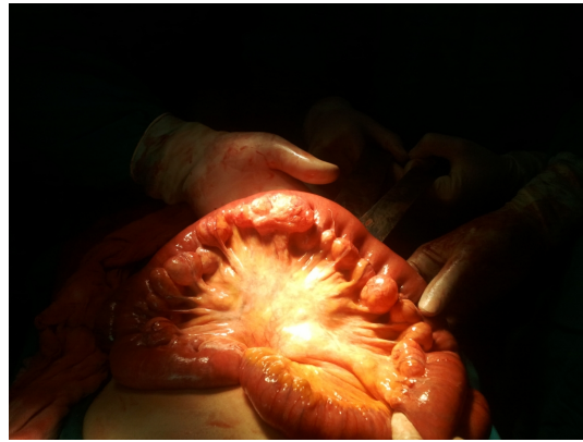
Şekil 1B :Multipl Divertiküller

Acilen operasyona alınan hastanın yapılan laparotomisinde, yaklaşık 80 cm lik jejunoleal barsak segmentinin mezenterik yüzünde en büyüğü 4 cm boyutunda ölçülen divertiküler lezyonlar görüldü(Şekil 1b).