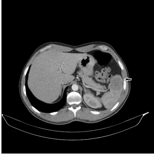
Şekil 3 : Çekilen toraks BT'de kesit alanına giren görüntülerde dalakta kitlesel lezyon görülmektedir(ok).

Akciğerdeki lezyonun trakea, özofagus ve vasküler yapılara yakın olması ile olası komplikasyon riskinden dolayı öncelikle dalaktaki lezyondan yaptığımız biyopsinin histopatolojik inceleme sonucu adenokarsinom metastazı olarak raporlandı. Hastaya cerrahi düşünülmeyi ve medikal onkoloji ünitesinde kemoterapi uygulandı. Hasta halen medikal onkoloji ünitesinde PET-BT ile takip edilmektedir.