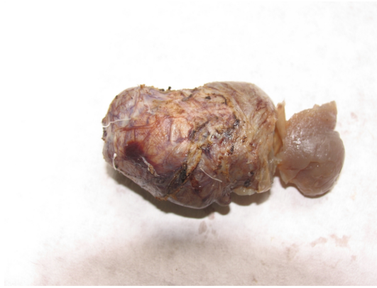
Şekil 1 : Bronkojenik kist, makroskopi

Otuzbir yaşında erkek hasta, kliniğimize bir yıldır devam eden yutma güçlüğü ve mide yanması şikayetiyle başvurdu. Fizik muayenesinde herhangi bir bulgu yoktu. Laboratuvar bulgularında herhangi bir bulgu saptanmadı. Yapılan torakoabdomen BT'de abdomende herhangi bir bulgu yokken, toraks kesitlerinde alt özofagus lateral komşuluğunda 48x46 mm boyutunda özofagusu sol laterale iten ve lümeni daraltan yoğun içerikli kistik lezyon görüldü. Hastanın yapılan üst gastrointestinal endoskopisinde 35.cm'den başlayıp 39.cm'ye kadar özofagus lümeninin 1/3lük kısmını saran endoskop geçişine izin veren bir kitle tespit edildi. Kitleden biyopsi alındı. Sonucu leiomyomla uyumlu geldi. Hastanın semptomlarının olması üzerine, ameliyat yapılmaya karar verildi. Beşinci interkostal aralıktan torakotomi yapıldı. Özofagial kist bulundu. Eksizyon yapıldı (Şekil 1).