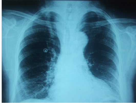
Şekil 1 : PA akciğer grafisinde üst mediastende genişleme ve trakeada itilme.

Elli beş yaşında kadın hasta göğüs hastalıkları polikliniğine gündüz aşırı uyku hali, tanıklı apne, gece horlama ve öksürük şikayetleri ile başvurdu. Kronik öksürük nedeni ile uzun süre öksürük ilişkili astım ve reflü tedavisi almış ancak tedaviden fayda görmemişti. Özgeçmişinde hipertansiyon dışında belirgin hastalığı yoktu. Hastanın yapılan fiziksel muayenesinde hemodinamik parametreleri normal olarak değerlendirildi. Vücut kitle indeksi (body mass index (BMI)) 21 idi. Solunum sistemi muayenesi normaldi. Boyun muayenesinde tiroid alt sınırı ele gelmedi. Akciğer grafisinde üst mediastende genişleme ve trakeada itilme mevcuttu (Şekil 1).